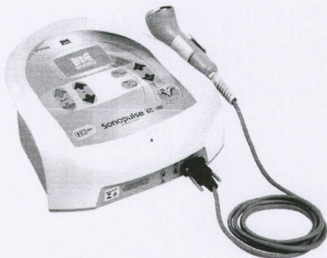
ME00000A - SONOPULSE III 1 E 3 MHZ S34, BIVOLT - IBRAMED Sonopulse III Ibramed - Aparelho de Ultrassom de 1 e 3 MHz